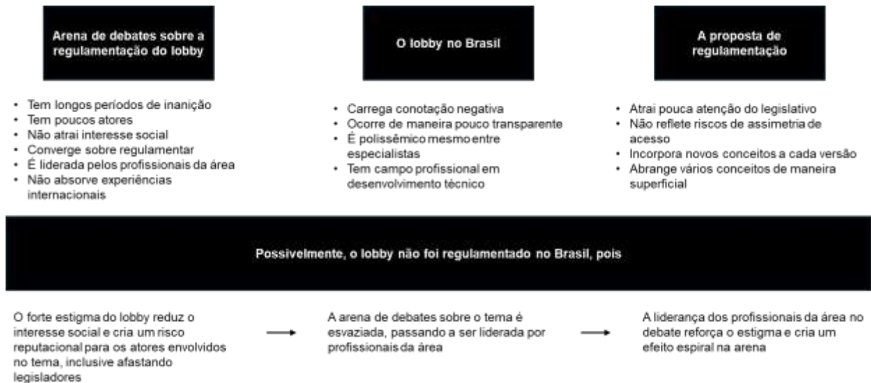
Figura 2 - Síntese da conclusão deste trabalho